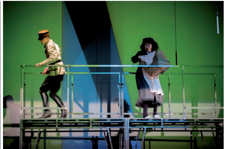
La croix de craie