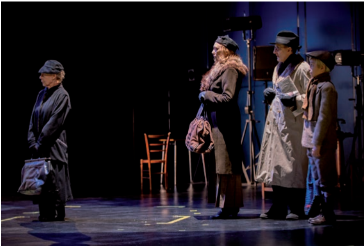
Le vieux militant