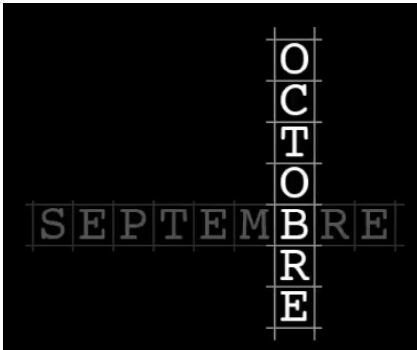
Passage du temps et des mois pendant le spectacle (vidéo)